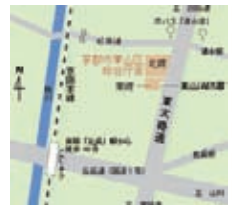
東山区総合庁舎地図