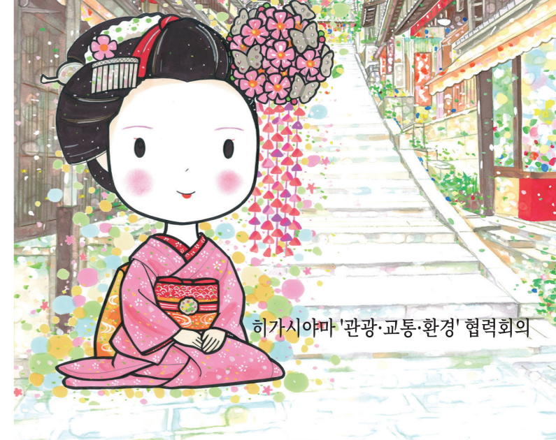
히가시아마 '관광·교통·환경' 협력회의