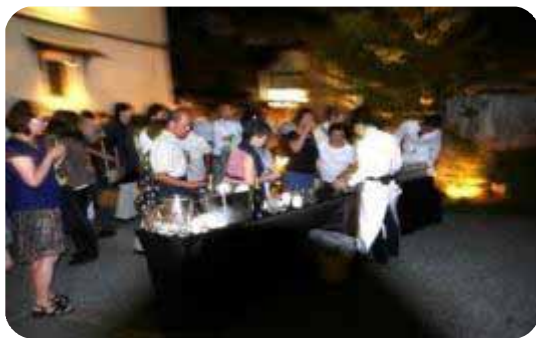
ご歓談される参加者