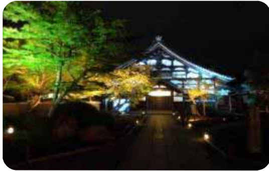
ライトアップされ幻想的な風景をみせる庭園

フィンガーフードもご用意し、特別にライトアップされた幻想的な風景の中、皆様思い思いに楽しまれている様子でした。