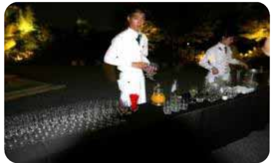
場内数カ所で飲み物をサービス