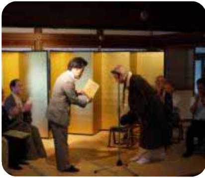
会員銘板贈呈の様子