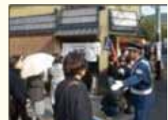
交通誘導員の配置 (上) 東山観光といれの設置 (右)

四季を通じて多くの観光客をお迎えする東山ならではの「観光」「交通」「環境」にかかわる課題解決と、東山の魅力発信・活性化のため、区内の寺社、企業、団体などが主体となり、平成17年9月に設立しました。