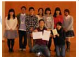
▲グッドサマリタンクラブ

この「英語で指差し道案内 in 東山」は、外国人観光客に京都案内を行っているボランティアガイドサークル「グッドサマリタンクラブ」の皆さんのご協力のもと、