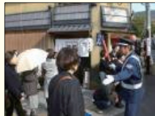
交通誘導員の配置 (上) 東山観光といれの設置 (右)

四季を通じて多くの観光客をお迎えする東山ならではの「観光」「交通」「環境」にかかわる課題解決と、東山の魅力発信・活性化のため、区内の寺社、企業、団体などが主体となり、平成17年9月に設立しました。