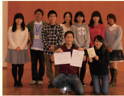
▲グッドサマリタンクラブ

この「中国語で指差し道案内 in 東山」は、外国人観光客に京都案内を行っているボランティアガイドサークル「グッドサマリタンクラブ」の皆さんのご協力のもと、平成27年2月に制作した「英語で指差し道案内 in 東山」を中国語に翻訳したものです。